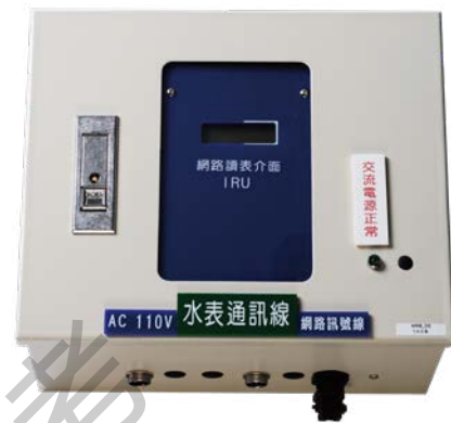
無線網路讀表介面