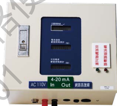
無線流量積算監測器