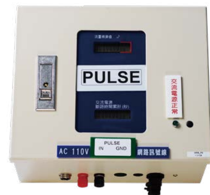
無線脈衝積算監測器